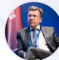
Владлен Максимов Президент Ассоциации малоформатной торговли России