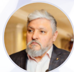
Игорь Бухаров Президент Федерации Рестораторов и Отельеров России