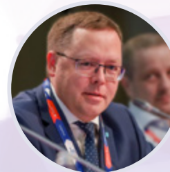
Андрей Карпов Председатель правления Российской Ассоциации экспертов рынка ритейла