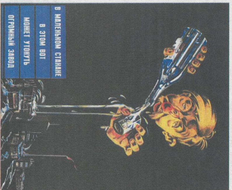
Плакат И. Ильина, 1929 г.

Андрей МИРОШНИКОВ фото автора и с сайта ww.admde.ru