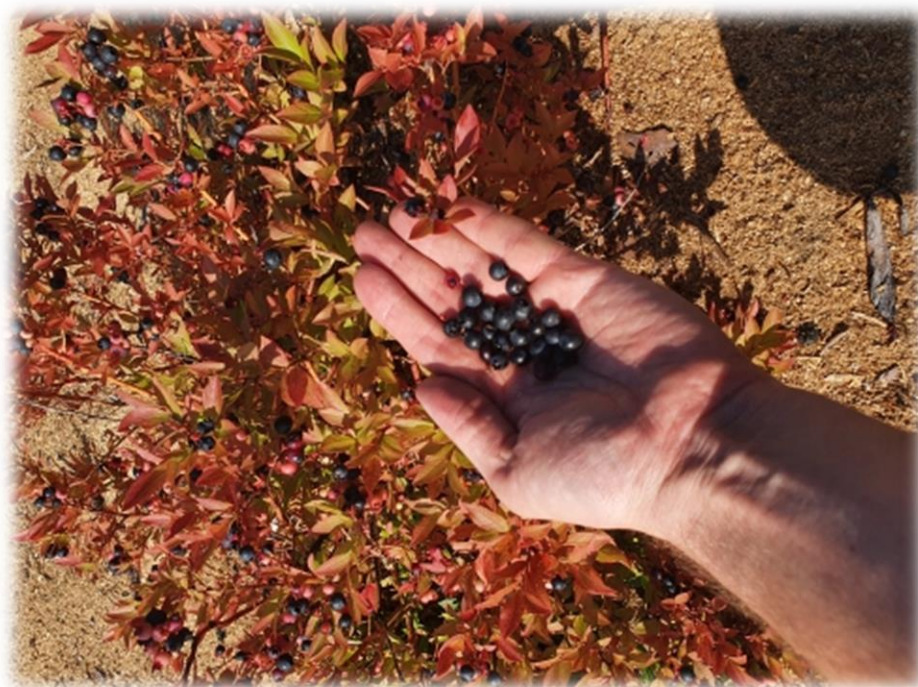
Рисунок 10 – Плодоношения голубики узколистной отборной формы № 2