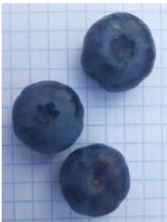
Рисунок 21 – Ягоды голубики узколистной