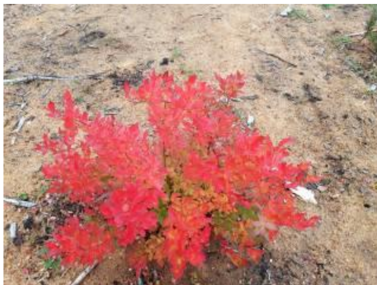
Рисунок 16 – Антоциановая окраска кустов голубики узколистной отборной формы №2