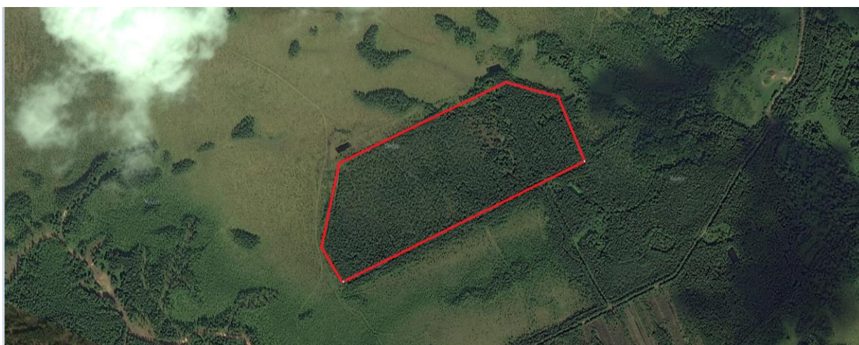
Рисунок 1 - Схема расположения земельного участка в приложении «Яндекс.Карты»

Агрохимическое обследование было проведено на земельном участке в Верхнетоемском районе Архангельской области расположенным 1,5 км южнее дер. Жаравинская. (Рисунок 1)