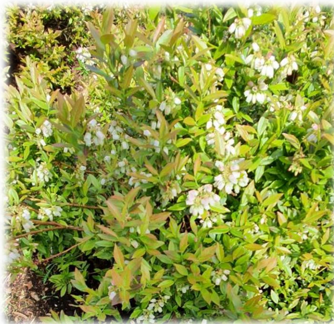
Рисунок 7 – Массовое цветение голубики узколистной