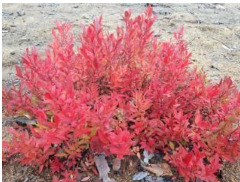
Рисунок 15 – Антоциановая окраска кустов голубики узколистной отборной формы №1