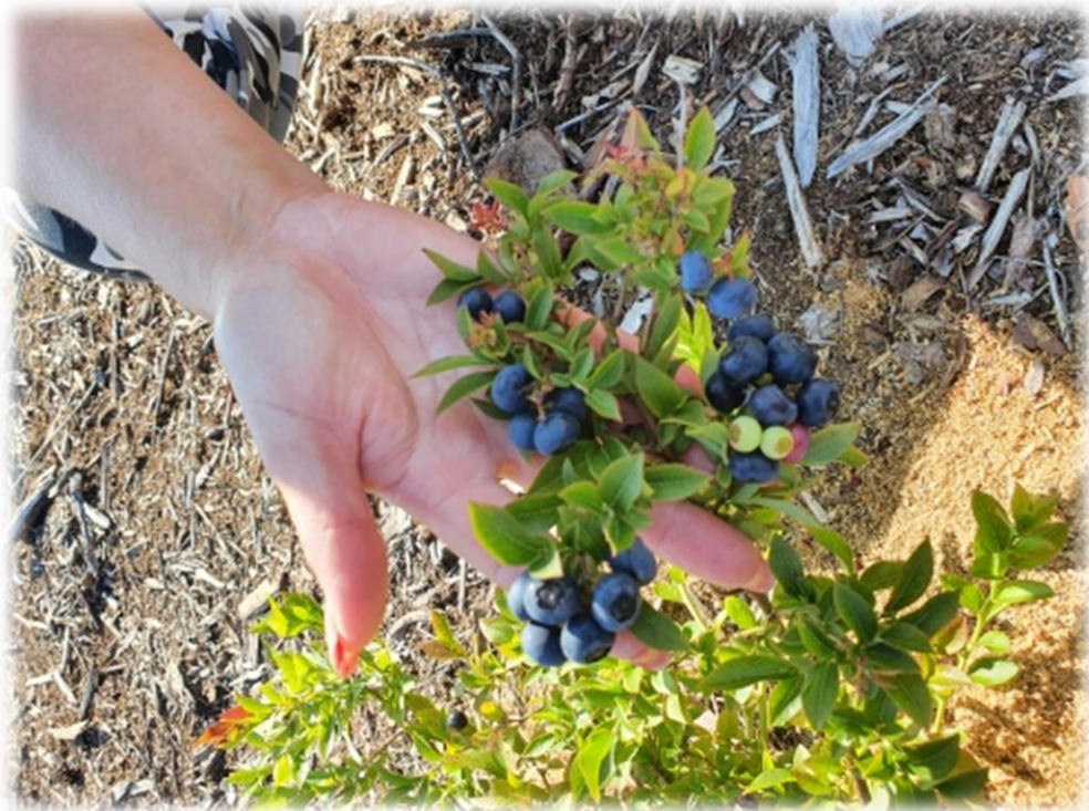
Рисунок 9 – Плодоношения голубики узколистной отборной формы № 1