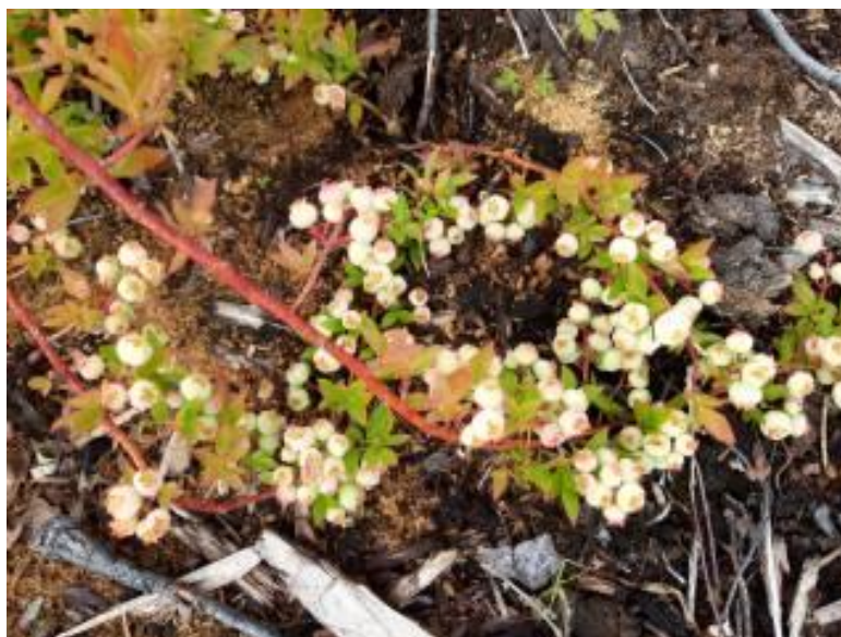
Рисунок 18 – Цветение голубики узколистной отборной формы №2