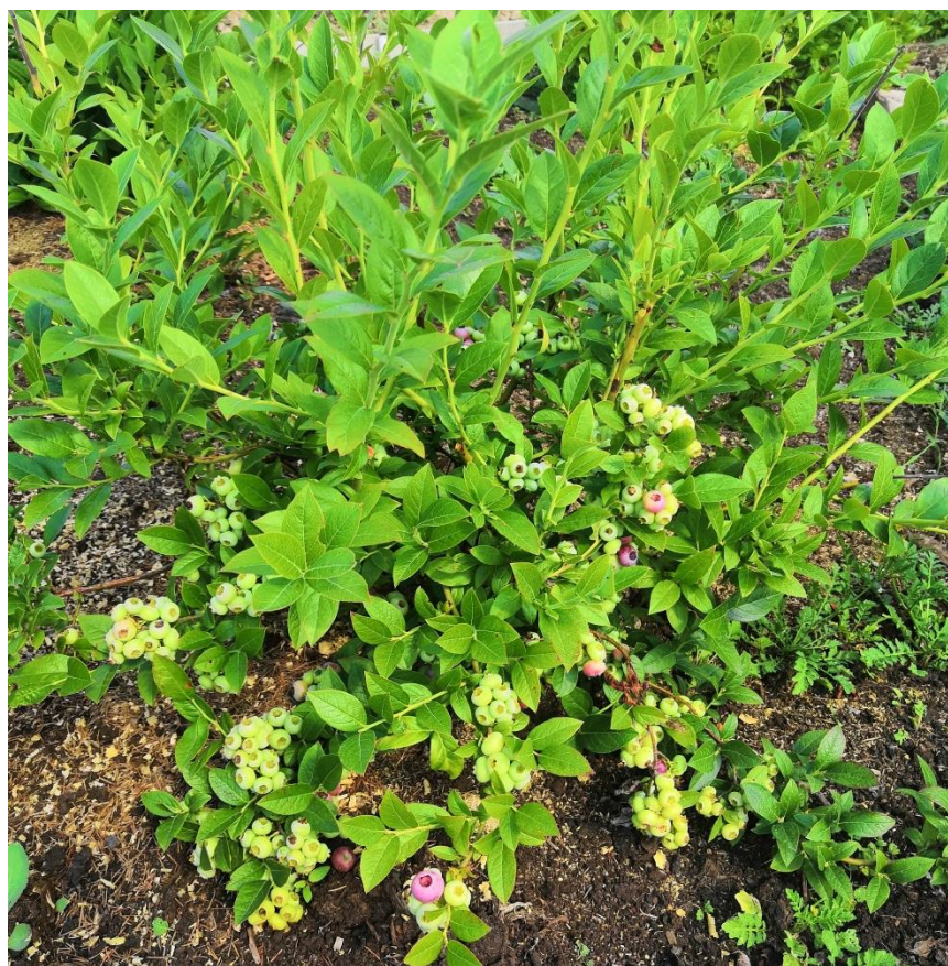
Рисунок 11- Плодоношение голубики узколистной и наклонение ветвей с ягодами к земле