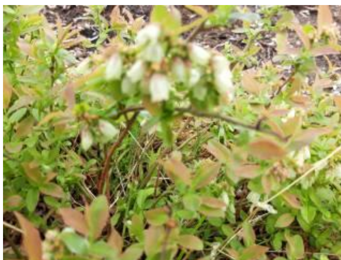
Рисунок 17 – Цветение голубики узколистной отборной формы №1