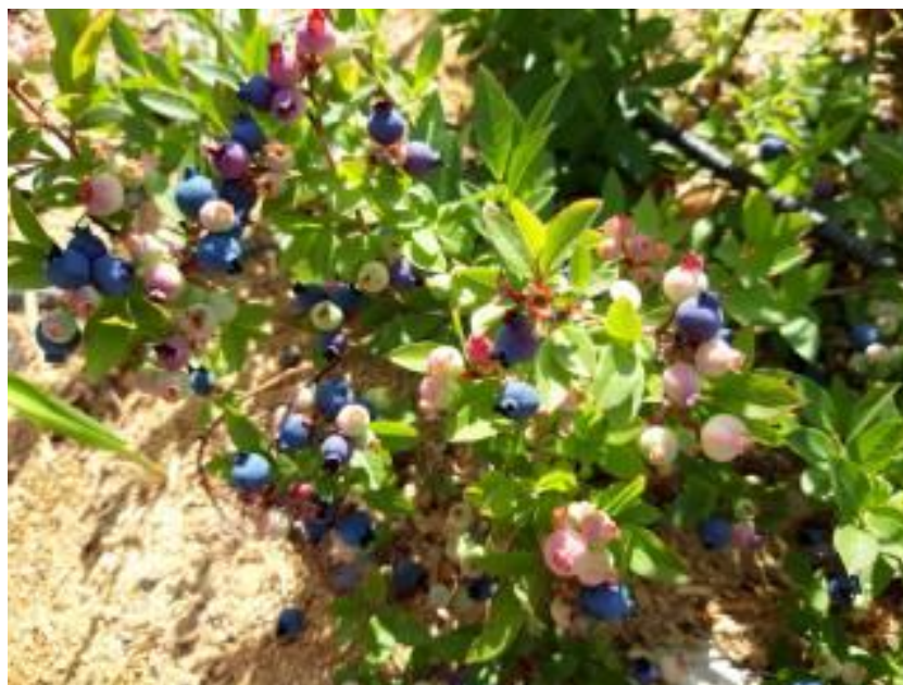
Рисунок 12 – Не полное созревание голубики узколистной отборной формы № 1