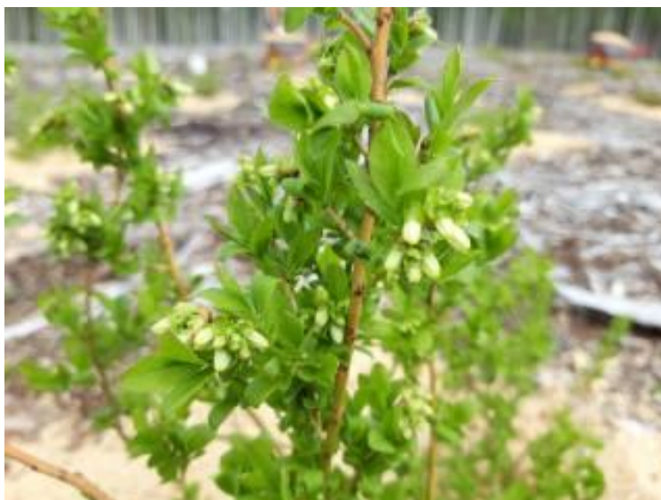
Рисунок 20 – Бутоны голубики узколистной