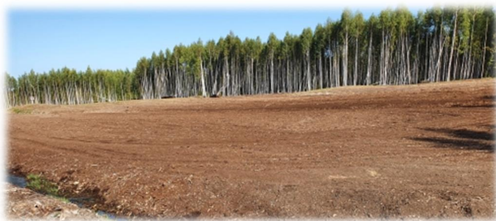
Рисунок 2 - Подготовленный торфяной участок