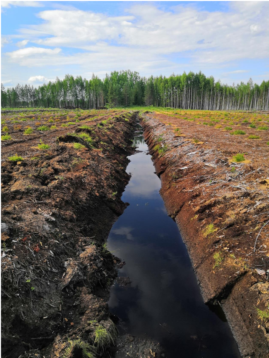
Рисунок 5 – Осушительная сеть экспериментальной плантации голубики в Верхнетоемском районе Архангельской области