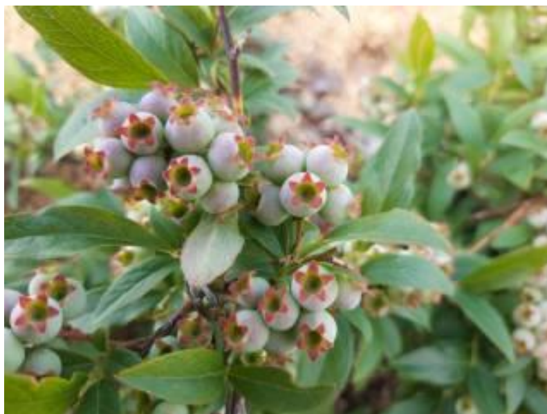
Рисунок 14 – Завязи голубики узколистной отборной формы №2