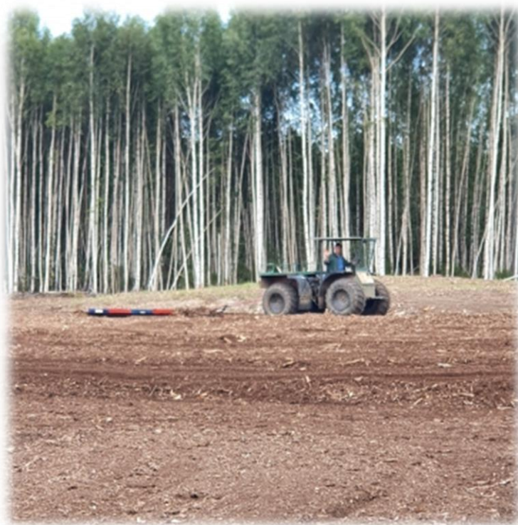
Рисунок 1 - Подготовка торфяного чека