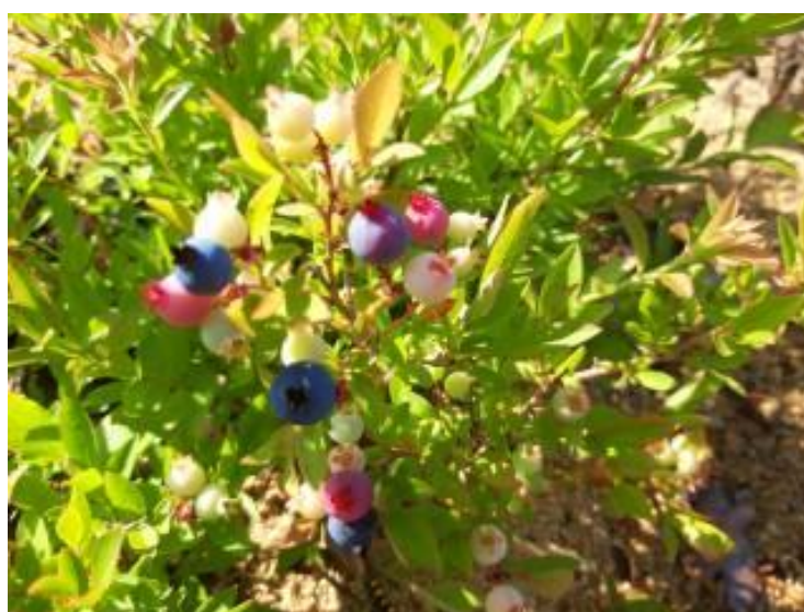
Рисунок 19 – Не полное созревание ягод голубики узколистной отборной формы № 2