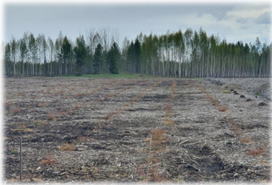
Рисунок 3 – Растения голубики после зимнего периода