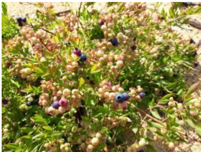
Рисунок 13 – Завязи голубики узколистной отборной формы №1