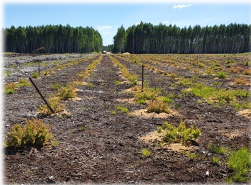
Рисунок 4 – Мульчирование рядов голубики узколистной