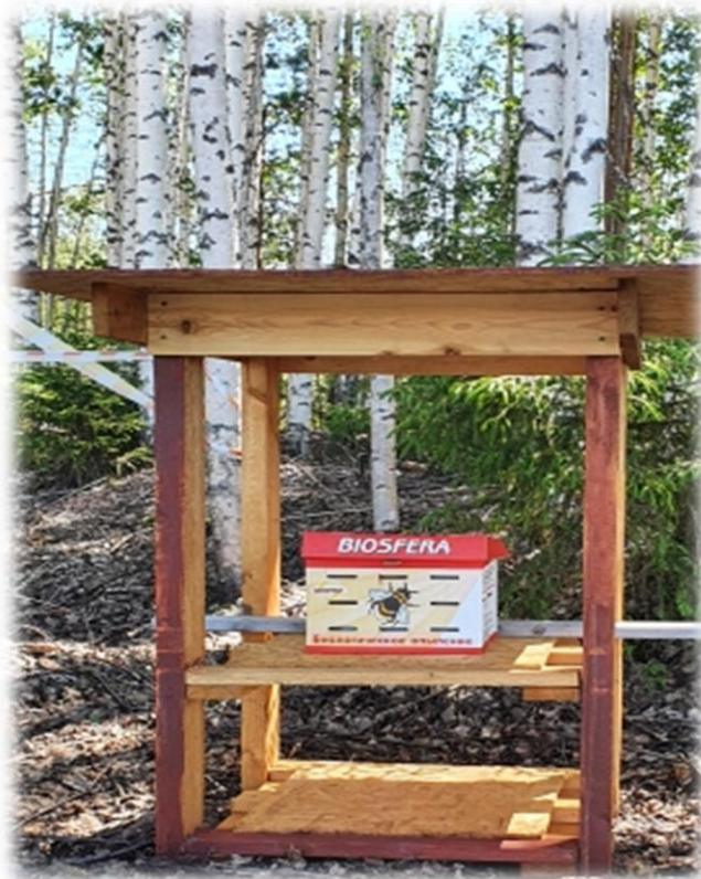
Рисунок 8 – Ульи со шмелями для опыления голубики узколистной