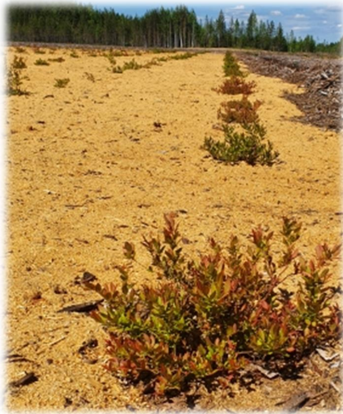
Рисунок 6 – Мульчирование опилками всей площади под голубикой