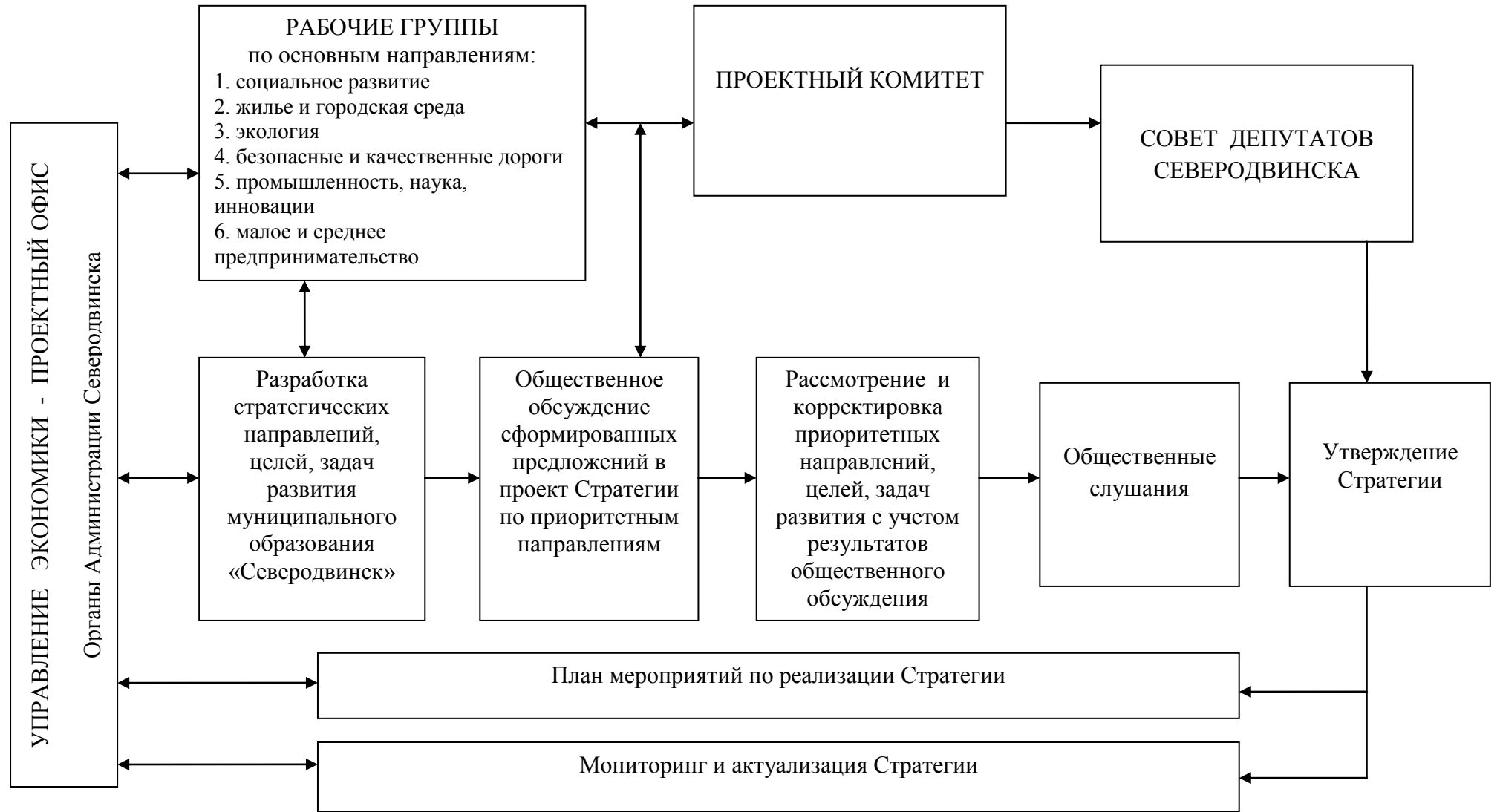
Схема процесса разработки и реализации Стратегии Северодвинска 2030