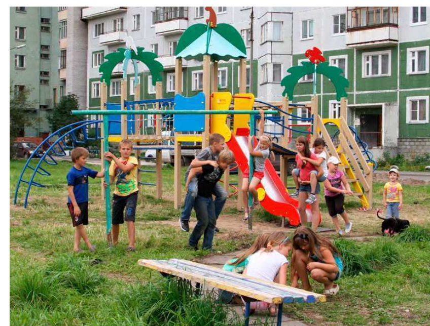
Уютный двор – это не мечта, а реальность!

Сейчас ПСД готова ещё на ряд дворов. Летом 2014 года они будут полностью благоустроены.