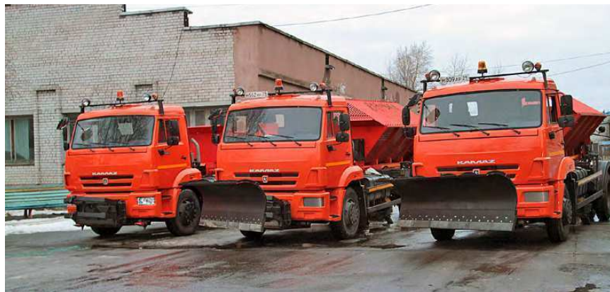
КАМАЗы для «Спецавтохозяйства».

Оснащаются новыми техническими средствами и частные организации, которые занимаются содержанием территорий города.