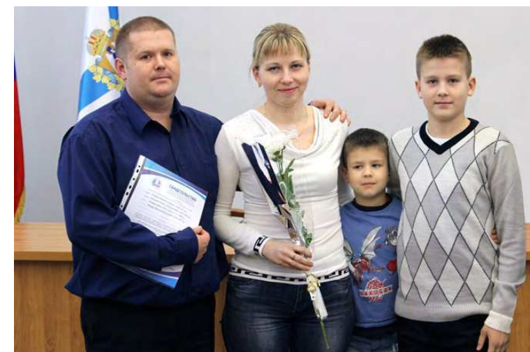
Семья Попковых получила долгожданное свидетельство.

За шесть лет работы программы 448 северодвинских семей приобрели собственные квартиры. На это израсходовано почти 280