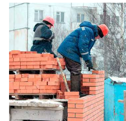
Жилой комплекс «Речной» – начало строительства.