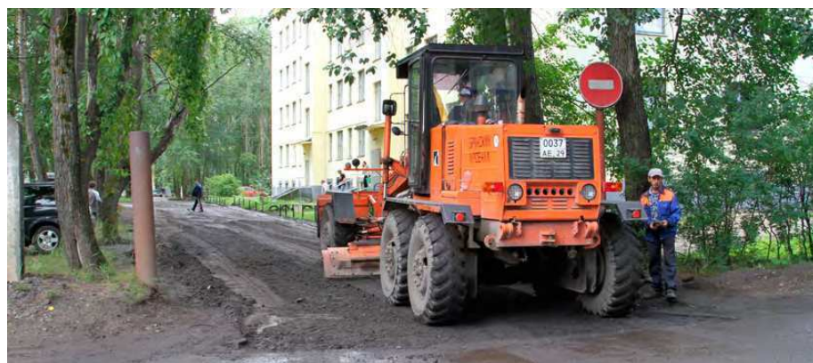
В городе бесперебойно работают государственные медорганизации. За счёт внебюджетных средств при содействии мэрии отремонтированы подъездные пути и внутренняя территория горбольницы №1, произведён ямочный ремонт территории горбольницы №2.

Продолжена оплата занятий для детей-инвалидов в спортивных секциях на сумму 580 тысяч рублей. Приобретено оборудование для работы реабилитационного класса компьютерной грамотности для слабослышащих и слепых людей.