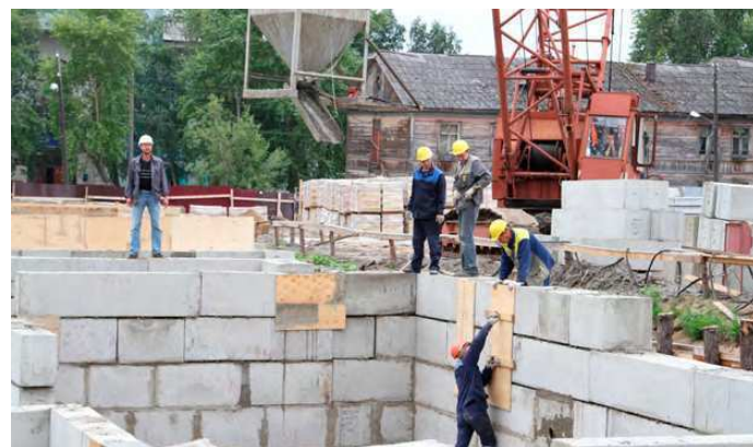
Социальный дом на ул. Индустриальной сдан в 2013 году. Ещё одна новостройка на ул. Индустриальной будет заселена в 2014-м.