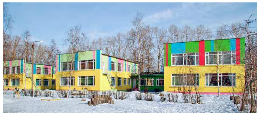
Детский сад «Беломорочка».

Впервые за полвека существования капитально отремонтирована школа №12. Объём затрат составил почти 12 млн рублей. Два года назад была разработана муниципальная программа по капитальному ремонту школьных спортзалов. Благодаря ей в 2013-м приведены в порядок залы семи школ на общую сумму около 10