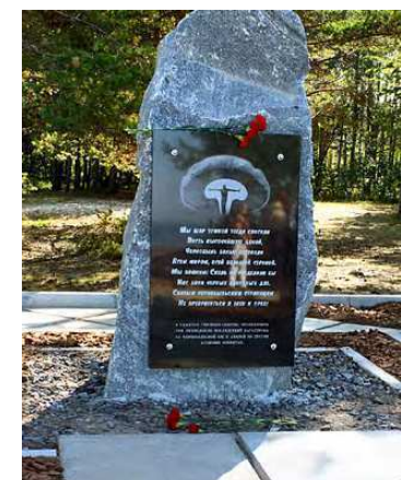
Для увековечения памяти ликвидаторов катастрофы на Чернобыльской АЭС на Ягринском воинском мемориале установлен Скорбный камень.

Партнёрские продуктивные взаимоотношения власти и некоммерческого сектора города позволяют реализовывать всё более интересные и яркие проекты.