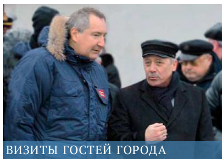
ВИЗИТЫ ГОСТЕЙ ГОРОДА

В шествии, посвящённом юбилею города, приняли участие около трёх тысяч горожан.