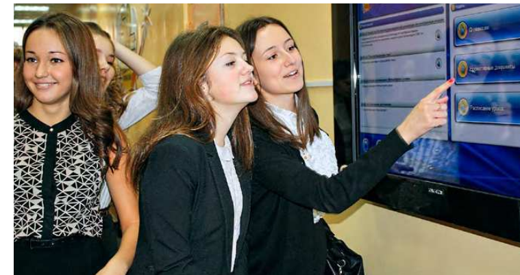
Электронное расписание в Северодвинской городской гимназии.

Начата работа по апробации и внедрению электронного дневника и электронного журнала успеваемости. В качестве инновационных площадок определены школы №2, 29, Северодвинская городская гимназия и лицей №17. В лицее также внедрена электронная система контроля «входа – выхода».