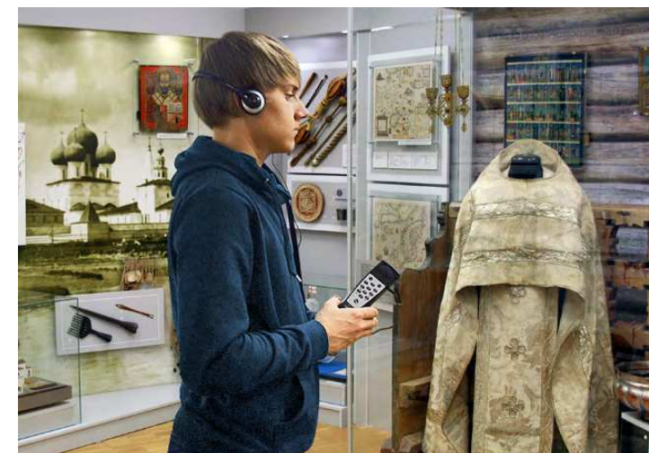
Городской краеведческий музей. Аудиогид.

В северодвинском городском краеведческом музее начал работу новый зал «История Поморского края с древнейших