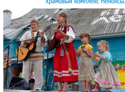
День поморского села.

церковь (1763 года) и колокольня (1834 года). Кроме того, здесь можно увидеть фрагменты старинных солеварен, подземных воздухопроводов и соляные амбары. Сегодня в селе Нёнокса и посёлке Сопка проживает более 1050 человек, а в летний период население возрастает до 3000.