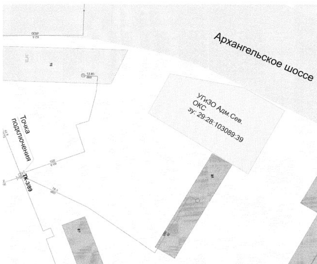
Приложение № 5