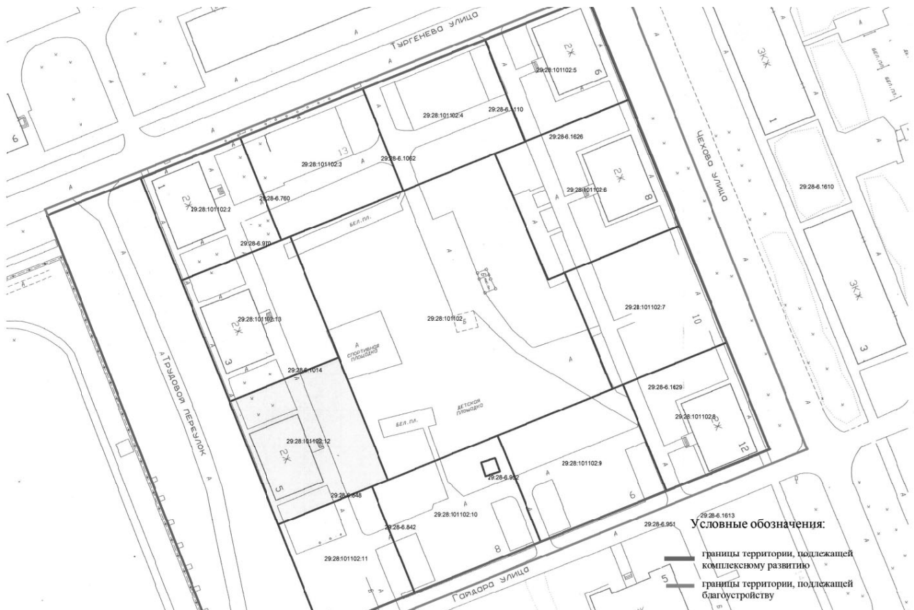
Приложение № 2 к договору о комплексном развитии территории жилой застройки в границах улиц Тургенева, Чехова, Гайдара и Трудового переулка от _____ № _____